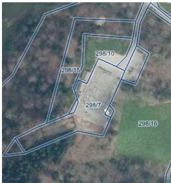
Slika 9. Posnetek zaslona parcelne razdelitve investicijske namere v Občini Logatec.