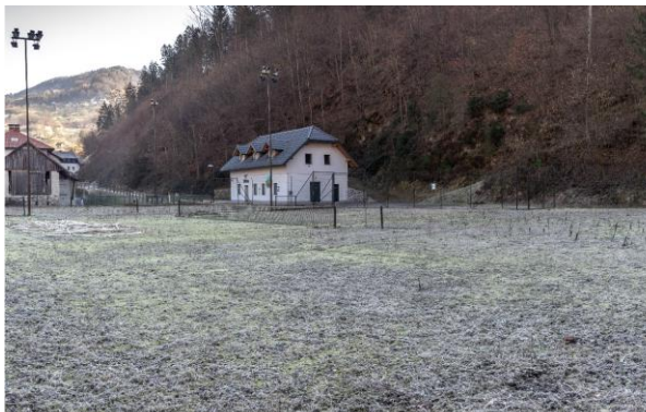
Slika 1. Stanje športnega parka Cerkno.

funkcionalnega objekta, ki bo služil kot garderoba, sanitarije ter prostor za shranjevanje opreme. Objekt bo opremljen z električno napeljavo, kar bo omogočilo uporabo lokalnim prebivalcem tudi v večernih urah ter zagotavljalo tudi osnovne pogoje za vzdrževanje higiene.