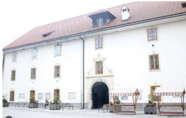
Slika 2. Stanje Rudniškega skladišča, kjer bo postavljeno dvigalo.