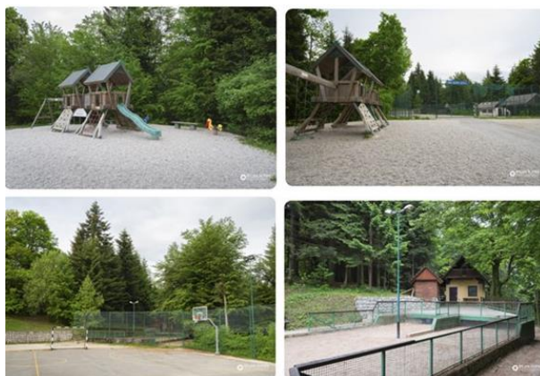
Slika 3. Stanje spremljevalnih objektov v športnem parku Rovte.

Projekt izhaja iz zaznanih potreb na območju, saj zajema vsebine, ki so bile v lokalnem okolju prepoznane kot prednostne za izvedbo v okviru strategije LAS s CILjem. Vse tri Občine na območju LAS s CILjem želijo vzpostaviti močnejše socialne vezi s postavitvijo primerne infrastrukture oziroma njene nadgradnje. Ker je prepoznana potreba po večji vključenosti ranljivih skupin (otroci, ženske, starejši, invalidi in priseljenci), bo predstavitev projekta na omenjenem območju potekala preko skupnih aktivnosti v katere bodo vključene ranljive skupine z namenom dviga kakovosti življenja na podeželju.