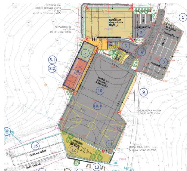
Slika 6. Grafični prikaz investicijske namere v Občini Logatec. Nov objekt je rdeče barve in se nahaja pod številko 8.