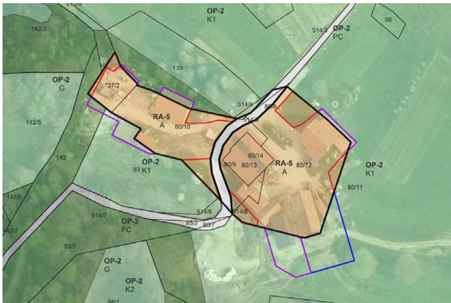
Slika 8: Preoblikovanje in povečanje stavbnega zemljišča posamične poselitve v EUP RA-5 v občini Logatec (modri poligon = povečanje stavbnega zemljišča; rdeči poligon = preoblikovanje-izvzem stavbnega zemljišča; vijolični poligon = preoblikovanje-povečanje stavbnega zemljišča).