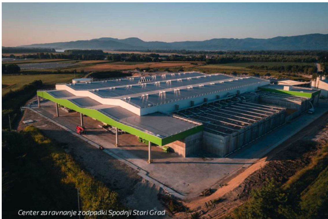
Slika 1: Center za ravnanje z odpadki Spodnji Stari Grad, Krško (novozgrajeni proizvodni objekt)

odpadkov, ki nima več uporabne vrednosti se odda podizvajalcu na odlaganje, ki upravlja z odlagališčem za nenevarne odpadke v skladu s predpisom, ki ureja odlagališče odpadkov.