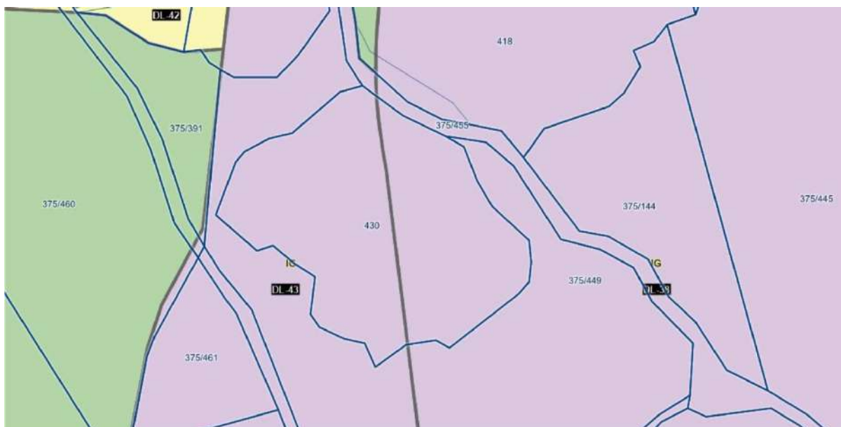
Slika 1: Izsek iz grafičnega dela OPN – namenska raba

Zemljišče je po osnovni namenski rabi opredeljeno kot